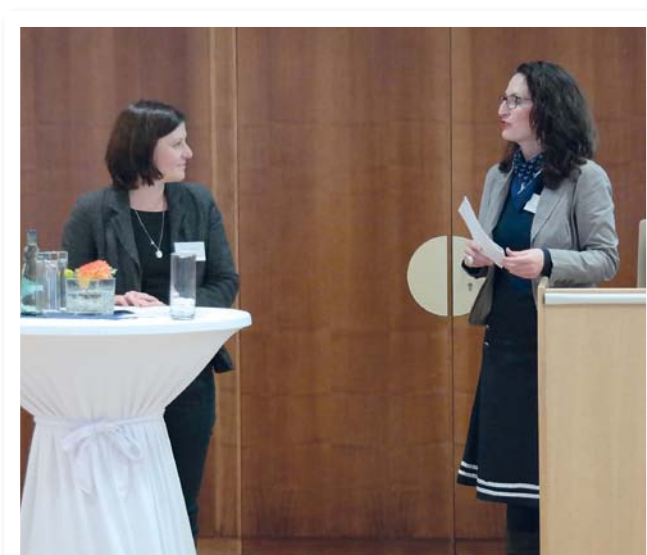
↑ Blitzlicher aus der Praxis im Interview