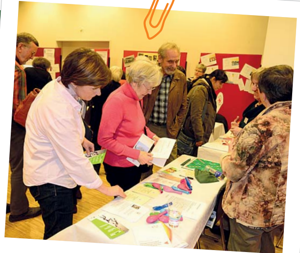
Markt der Möglichkeiten

Dr. Engel: Durch die Förderung eines (frühzeitigen) Miteinanders im Quartier, von Kontakt und Austausch, wird die (spätere) Annahme von Hilfe und Unterstützung erleichtert. Ebenso werden Freiwillige, u. a. im Umfeld von Pflege, gewonnen und geschult. Durch Angebote des Austausches und der Qualifizierung versuchen die Stabsstelle Altenplanung gemeinsam mit der Freiwilligenagentur auch nach Projektende, die Initiativen in ihrer Arbeit zu stärken und zu unterstützen. Begegnung, Kultur und auch Nachbarschaftshilfe in den einzelnen Stadtteilen können so längerfristig Bestand haben. Die Rolle der Kommune ist dabei die der Förderung und Begleitung; eine dienstleistende unter Wahrung des Eigensinns und -charakters des freiwilligen Engagements. Zukünftig werden professionelle Akteure des Sozial- und Gesundheitsbereiches, Dienstleister und Gewerbetreibende stärker einzubinden sein.