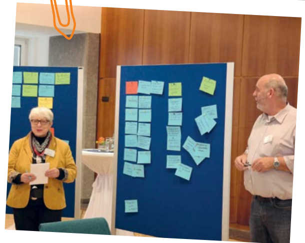
Eindrücke World-Café

Genau hier setzen Anlaufstellen an. Sie unterstützen die kommunale Altenhilfe und übernehmen eine wichtige Funktion für die Versorgungssicherheit. Mit ihnen entstehen in Stadt und Land „Möglichkeitsräume“. Sie klären, was vor Ort gebraucht wird, koordinieren alle verfügbaren Informationen und Angebote und vernetzen die verschiedenen Personen. Konkurrenzen werden ausgeglichen und moderiert, so dass Angebote im Miteinander entstehen.