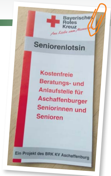
Flyer zum Projekt „Seniorenlotsin“

Seidel: Eine Fülle von Informationen strömt ständig auf uns alle ein. Zielgerichtete Informationen sind aber elementar, um ein selbstbestimmtes Leben zu führen und aktiv an der Gesellschaft teilhaben zu können. Jedoch ist es gerade für ältere Menschen schwierig, das immer differenziertere und wenig transparente Gesundheits- und Sozialwesen zu verstehen. Wenn dann auch noch eine schwere Krankheit oder gar Pflegebedürftigkeit einsetzt, erhöht sich diese Komplexität nochmals. Ob Wohnraumberatung, Beratung zu Fragen der Pflege, Heimplatzsuche, Fragen zu Demenz oder welche Freizeitangebote es für Seniorinnen und Senioren in der Stadt gibt – die Seniorenlotsin hilft und ist eine transparente Anlauf- und Beratungsstelle für ältere Aschaffener und deren Angehörige.