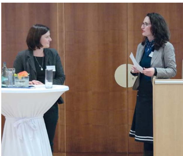
↑ Blitzlicher aus der Praxis im Interview