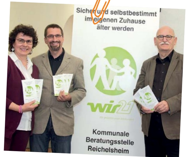
Projektbeispiel Reichelsheim

www.mtidw.de (BMBF-Seite „Mensch-Technik-Interaktion im demografischen Wandel“)