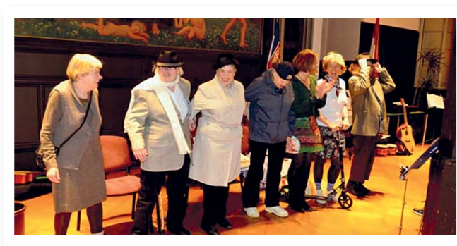
Bühne frei für mitreißende Nachbarschafts- und Bürgeraktionen

Dr. Engel: In Umsetzung der Ergebnisse aus den Befragungen Älterer sind mit Beratung und Begleitung der Stabsstelle Altenplanung sowie der Freiwilligenagentur Bürgercafés, Mittagstische und andere Begegnungsangebote entstanden. Ebenso gibt es Bewegungsgruppen, wie z. B. Gymnastik oder Spaziergertreffen, Freizeit- und Hobbygruppen sowie neue organisierte Nachbarschaftshilfen. Sie alle tragen dazu bei, dass ältere Stadtteilbewohner/innen besser und länger in das vertraute Umfeld eingebunden sind und letztlich dort wohnen bleiben können. Die Projektgelder ermöglichen den organisierten Austausch der Initiativen und Akteure untereinander: u. a. durch einen Markt der Möglichkeiten, eine neue Broschüre „50+, Angebote und Initiativen“, gemeinsam gestaltete Öffentlichkeitsarbeit.