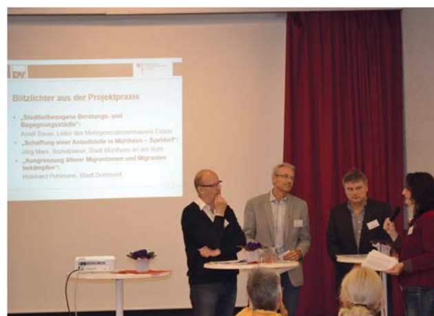
↑ Blitzlichter aus der Praxis im Interview, Copyright: Schlesinger, DV

Das Helfernetzwerk des Sozialamtes der Stadt Mülheim an der Ruhr basiert auf einem Sozialraumkonzept. Dieses setzt eine enge Verzahnung von kommunalen Hilfen mit