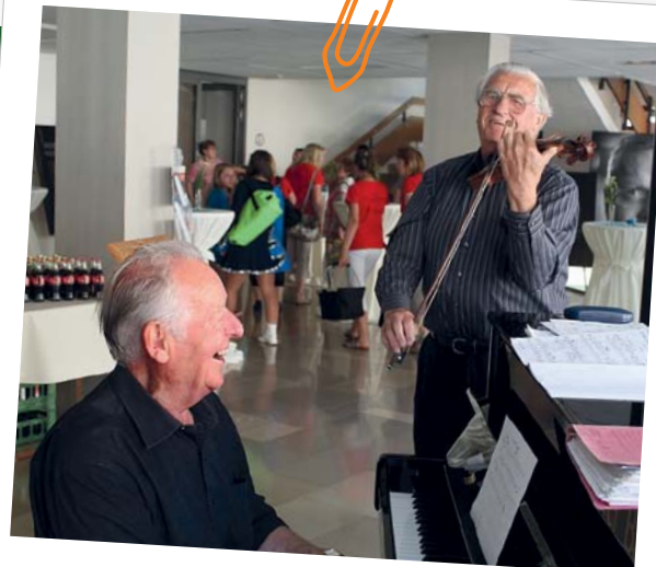
Veranstaltung „Reife Leistung kennt kein Alter“

Bucka: Aussagen von Seniorenberaterinnen und Seniorenberatern: „Das freiwillige Engagement gibt mir die Bestätigung, dass mein beruflich oder privat erworbenes Wissen nicht verloren geht, sondern meist mit positiver Rückmeldung weitergegeben werden kann.“ „Ich lerne selbst viel Neues dazu, was den Alltag von Seniorinnen und Senioren betrifft.“ „Durch das Netzwerk gehöre ich zu einer interessanten Gruppe von Gleichgesinnten und werde auch in meiner nachberuflichen Phase gebraucht.“ „Sehr hilfreich sind für mich die Netzwerktreffen, Fortbildungen und gemeinsamen Exkursionen.“ „Bei Fragen werden wir von zwei Koordinatorinnen oder den Kolleginnen und Kollegen jederzeit unterstützt“.