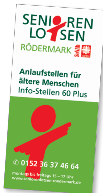
→ Flyer zum Projekt „Infostellen 60+“

Geiken-Weigt: In wöchentlichen Sprechstunden in zwei Stadtteilen gilt als oberstes Ziel, dass Ältere solange wie möglich zuhause bleiben können. Die Ziele wurden in einem gemeinsam entwickelten Leitfaden festgelegt. Die Senioren-Lotsen beraten in den Anlaufstellen nicht nur zum Hilfebedarf, sondern auch wo es Sport- und Freizeitangebote gibt und wo man sich engagieren kann.