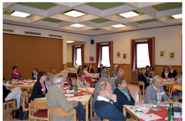
↑ Werkstattgespräch Essen